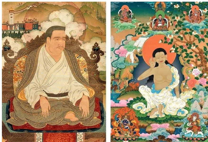
噶舉派祖師 - 馬爾巴 (左圖), 米拉日巴 (右圖)